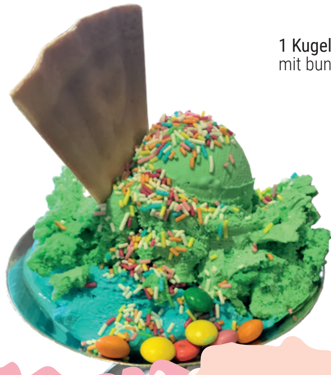
1 Kugel Eis mit bunten Streuseln 1 und Smarties 1